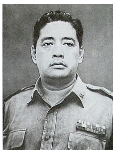
Foto tersebut adalah tokoh pahlawan revolusi yaitu ...