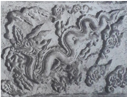
Hình rồng trên bệ Tam Thế

Các tác phẩm chạm khắc trang trí vẫn thể hiện những đề tài quen thuộc, tuy vậy cũng có một số thay đổi như đề tài thể hiện tổng hợp: đầu rồng, sừng tê, ngọc báu... Hình tượng các cô tiên dân hương, dâng hoa đều thể hiện trong hình thức nửa người nửa chim rất phong phú và sinh động. Hình tượng rồng mặc dù về cơ bản vẫn giữ được nhiều nét thừa kế rồng thời nhà Lý song cách biểu hiện lại có nhiều sự thay đổi, các khúc uốn cong không còn đều đặn, thoăn thoắt mà khúc doãng, khúc mau tạo sự sống động và hiện thực hơn. Nét hình rồng thời Trần khỏe khoắn, mập mạp, cứng cáp hơn hình rồng thời Lý.