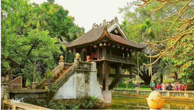
Chùa Một Cột, Hà Nội

một cột cao 4m. Ngoài ra còn có chùa Phật tích (Tiên Sơn, Bắc Ninh), chùa Dạm (Quế Võ, Bắc Ninh)... cũng là các chùa có kiến trúc đẹp và quy mô lớn của thời Lý.