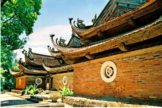
Chùa Tây Phương (Hà Tây)

Nghệ thuật điêu khắc: điêu khắc thời Tây Sơn chủ yếu là tượng tròn, chắc, đóng kín, được thể hiện với phong cách hiện thực, sống động. Vẻ đẹp của tượng là vẻ đẹp hoàn thiện giữa ngoại hình và nội tâm nhân vật. Đặc biệt là các pho tượng ở chùa Tây Phương. Chất thần bí cao siêu giảm dần, thay vào đó là các nét tình cảm của con người như vui, buồn, giận giữ, yêu thương... khiến cho tượng tôn giáo trở nên gần gũi với dân gian. Đường nét phong phú, dứt khoát tạo ra các bố cục cô đọng, chắc chắn cho các pho tượng.