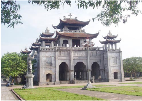
Nhà thờ Phát Diệm (Ninh Bình)

Đạo Thiên Chúa được truyền bá vào Việt Nam và công khai truyền đạo dưới thời nhà Nguyễn. Một số nhà thờ được xây dựng như: nhà thờ Đức Bà (Sài Gòn), nhà thờ Lớn (Hà Nội), nhà thờ Phát Diệm (Ninh Bình). Trong đó, nhà thờ Phát Diệm là một công trình kiến trúc kết hợp nhuần nhuyễn giữa hai yếu tố phương Tây và dân tộc.