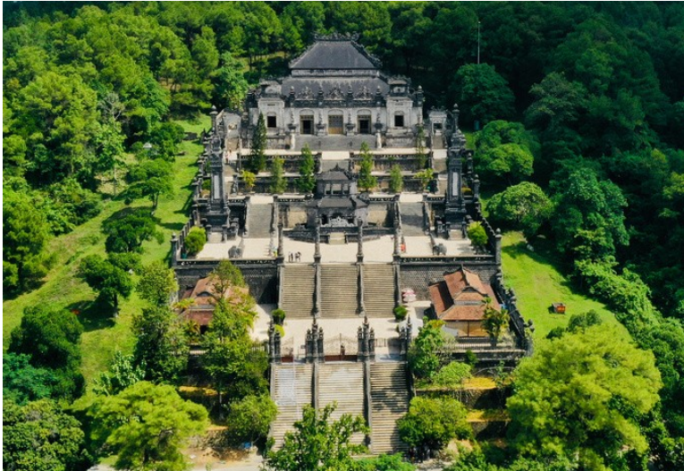
Lăng Khải Định

cảm giác u hoài của một khu lăng mộ nhường chỗ cho không khí sinh động của một công viên thanh lịch.