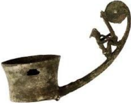
Tượng người thổi khèn trên cán muôi (Việt Khê – Hải Phòng)