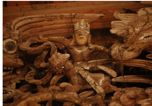
Múa trên lưng rồng. Đình Liên Hiệp