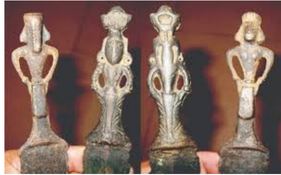
Tượng người trên cán dao (Đông Sơn – Thanh Hóa)