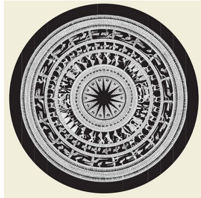
Hoa văn trên trống đồng Ngọc Lũ

Phần lớn các hoa văn trang trí trên đồ gốm đều được bố cục thành các dải băng ngang. Đôi chỗ và tùy theo loại hình mà các nghệ nhân tạo các bố cục ô dọc theo thân gốm. Tất cả đều được gợi từ những hình mẫu có sẵn trong tự nhiên nhưng được cách điệu hoặc đơn giản hóa và mang trình độ thẩm mỹ cao.