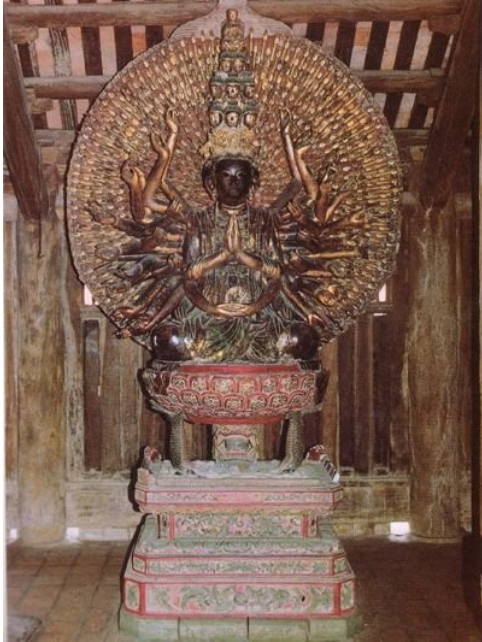
Tượng Quan Âm nghìn mắt nghìn tay