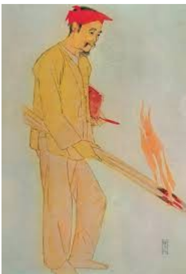
Đốt đuốc đi học . Tranh của Tô Ngọc Vân