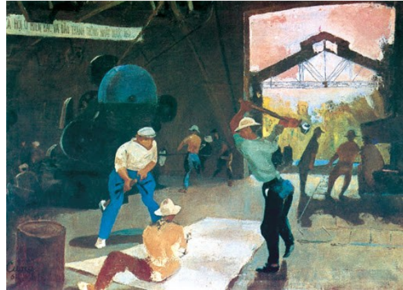
Công nhân cơ khí