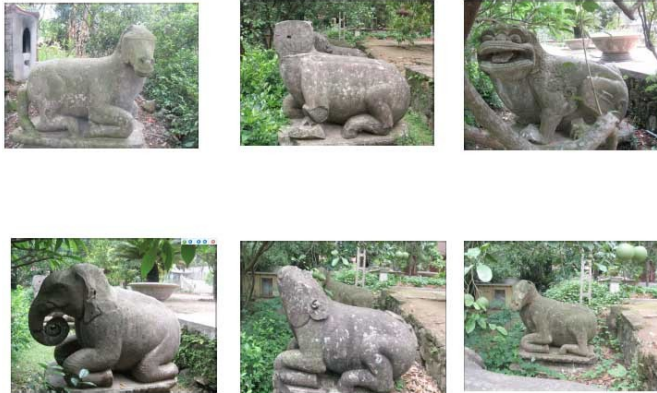
Tượng thú chùa Phật Tích

Nghệ thuật điêu khắc: nghệ thuật điêu khắc thời Lý cũng gắn liền với nghệ thuật kiến trúc. Đi cùng với kiến trúc chùa tháp là các pho tượng Phật, tượng thờ, các chạm nổi trên gỗ, đá với nhiều đề tài khác nhau.