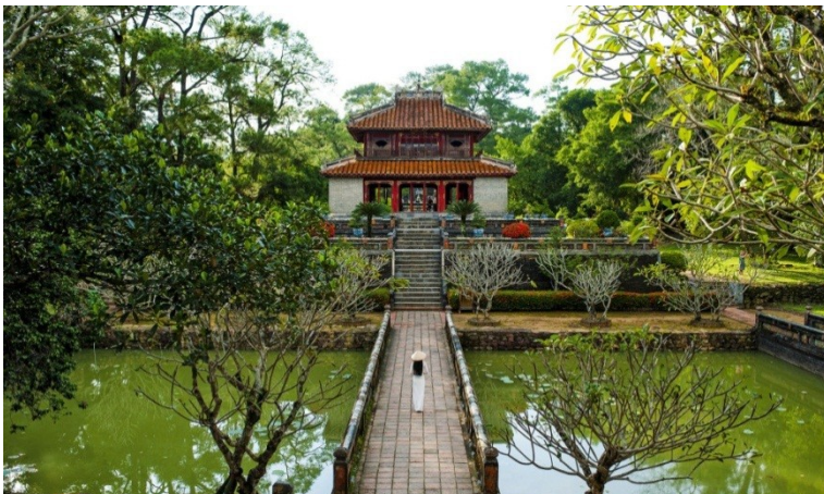
Lăng Minh Mạng