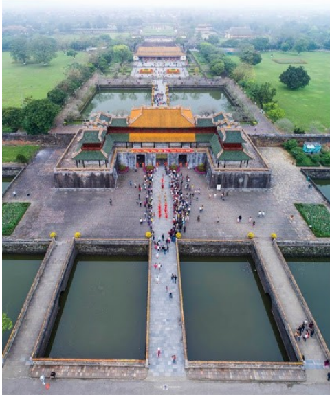
Toàn cảnh kinh thành Huế

- Nghệ thuật cung đình: năm 1803 vua Gia long cho xây dựng kinh thành Huế, đây là một trong những kiến trúc cung đình nổi bật nhất và còn tồn tại đến ngày nay. Kinh thành là một hình vuông, gồm ba vòng thành với kiến trúc sắp xếp cân đối, đối xứng. Khu Đại Nội với tên gọi các công trình có điểm trùng lặp với các cung điện của thành Bắc Kinh, song thành Huế thực sự là một công trình kiến trúc mang phong cách Việt Nam.