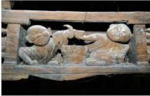
Chuốc rượu. Đình Hoàng Xá