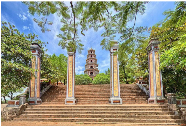
Chùa Thiên Mụ (Huế)

- Kiến trúc tôn giáo: nhà Nguyễn đề cao Nho Giáo, vì vậy năm 1803 nhà Nguyễn cho xây dựng Quốc tử giám ở kinh đô Huế, ngoài ra còn xây dựng Văn Miếu hàng tỉnh ở các địa phương. Đối với Phật giáo, nhà Nguyễn có phần hạn chế, chùa mới không được làm, chùa cũ đổ nát mới được tu bổ. Chùa Thiên Mụ là một trong những kiến trúc chùa nổi bật được xây dựng dưới thời nhà Nguyễn.