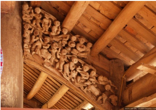
Hội mùa. Đình Thổ Tang