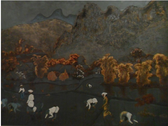
Tổ đổi công miền núi